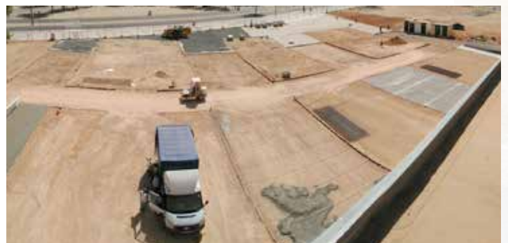
Accesos posteriores del Pabellón Vicente Paniagua

Alcázar dispone de 10 Km. de carril bici, el mayor de la provincia