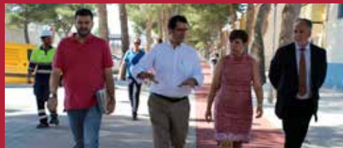
Ciudad del Siglo XXI Diseño urbanístico