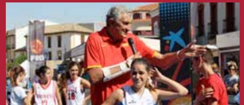
Ciudad Deportiva Centro del deporte regional