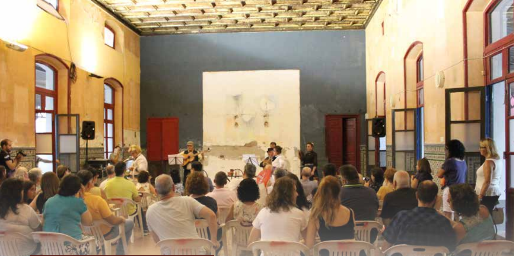
“Alcázar de Villa a Ciudad”- Fonda de la Estación Asociación ‘Los que vamos quedando’