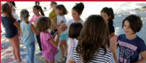
Ciudad Educadora Mejorando servicios