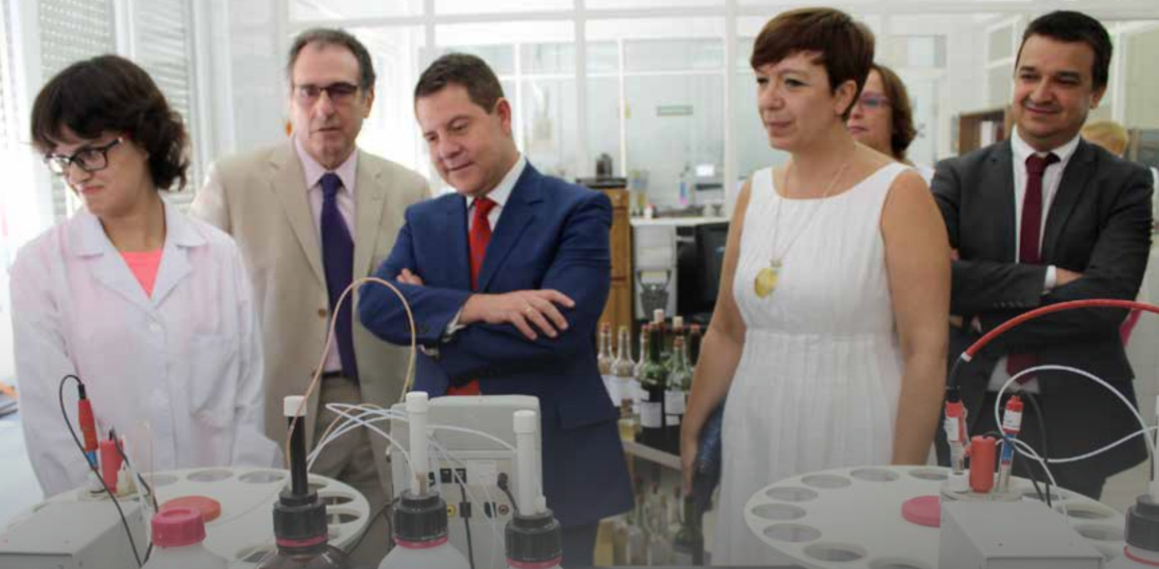
El presidente de Castilla la Mancha en la reapertura de la Estación de Viticultura y Enología de Alcázar de San Juan