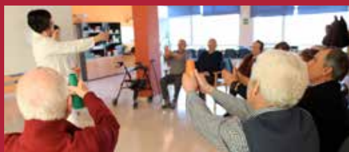
Ciudad Solidaria e Inclusiva Excelencia en Servicios Sociales