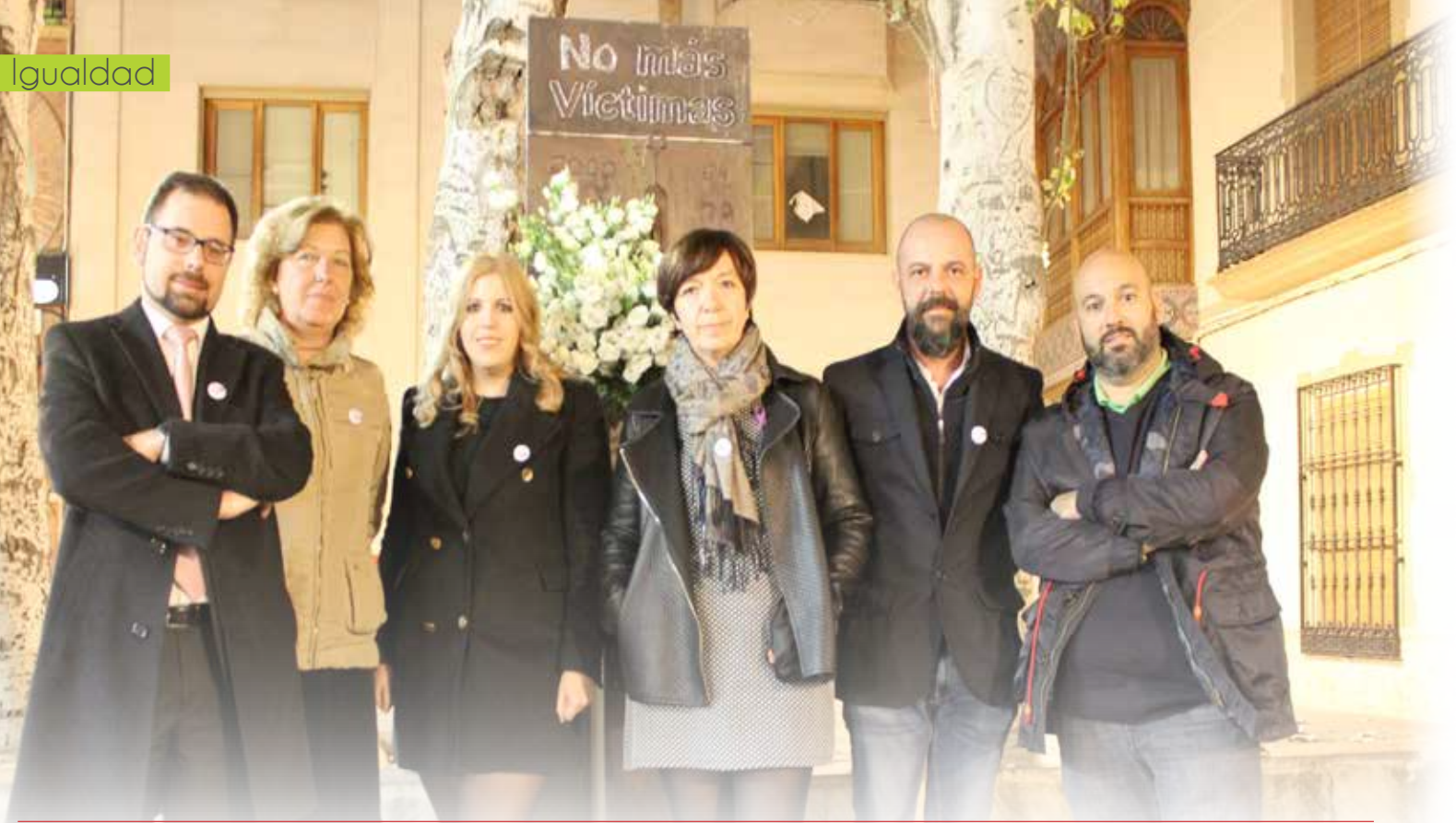
Frente al monolito en memoria de las víctimas por violencia de género. Acto institucional del 25 de Noviembre de 2017