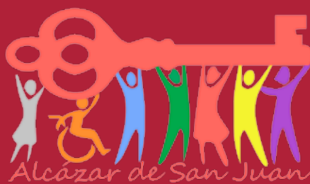
Ciudad Abierta Presupuestos Participativos