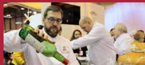
Ciudad Turística Destino de Calidad