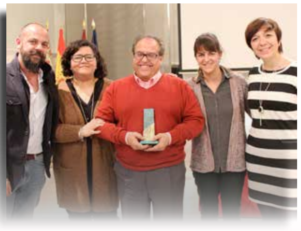
Alcázar recibió el premio de la FEMP el 30 de noviembre, Día de las Ciudades Educadoras