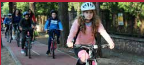
Ciudad sostenible y dinámica Ciclobús y Pedibús