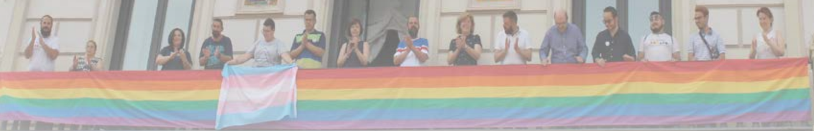
El Ayuntamiento se sumó un año más a la celebración del Día del Orgullo LGBTI