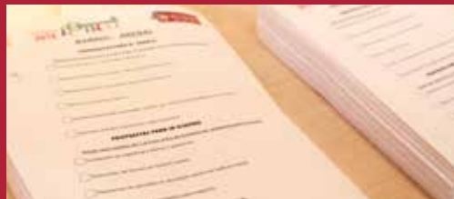
Ciudad participativa Corresponsabilidad ciudadana