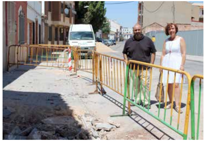
Reparación de acerado en calle Gracia

“El mantenimiento y acondicionamiento de la ciudad es una labor necesaria y constante”