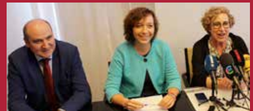
Ciudad Comprometida con la Salud Nuevas plazas residenciales