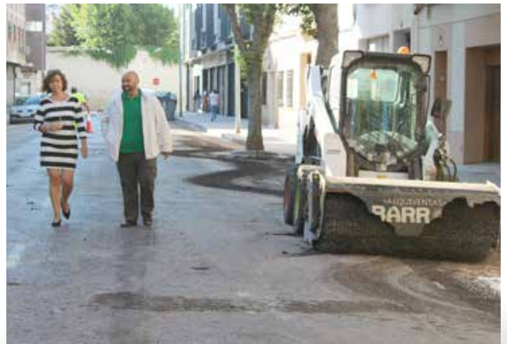
Obras de pavimentación en la calle Antonio Castillo