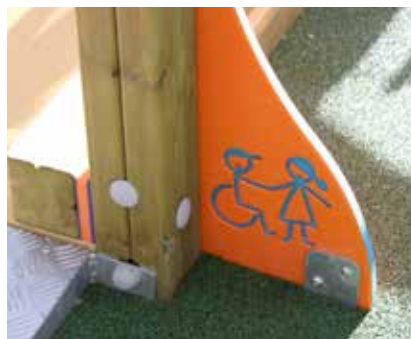
Nueva zona infantil inclusiva en el Parque Alces