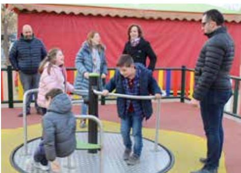
Carrusel inclusivo en El Arenal