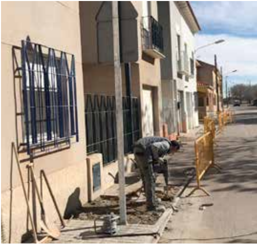
Acerado en Goya - Parque Cervantes