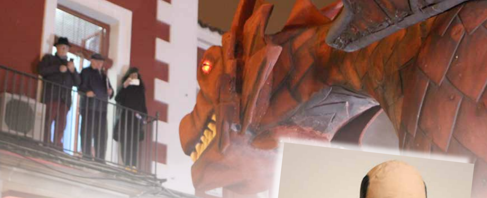
Una llamativa carroza del Desfile del Carnavalcázar 2018

EL CARNAVALCÁZAR 2018 no defraudó. Numerosos visitantes y alcazareños disfrutaron de todas las actividades previstas, especialmente del Gran Desfile de Comparsas y Carrozas. Variedad, colorido y animación caracterizaron uno de los desfiles más participativos de los últimos años, en el que concursaron un total de 20 comparsas llegadas desde diferentes puntos de la región.