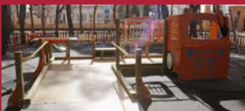
Ciudad inclusiva y accesible Parques inclusivos