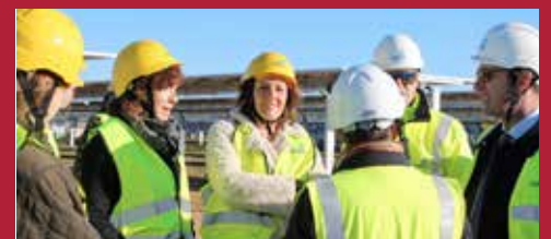
Ciudad atractiva para la inversión Generación de empleo