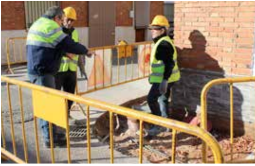
Rebajes y barbacanas en Santa María