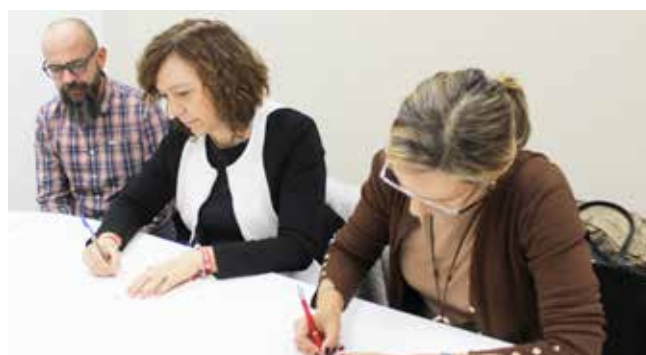
Firma para la adquisición del Teatro Cine Crisfel

EN UNA SEGUNDA fase, se construirán unas nuevas instalaciones, en los terrenos anexos, para albergar a las numerosas asociaciones y colectivos culturales de la ciudad.