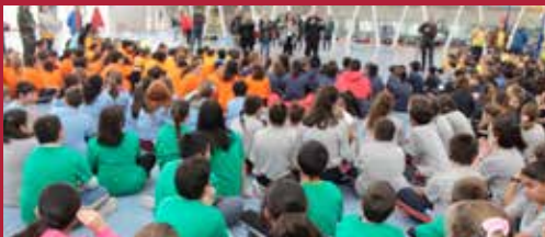
Ciudad educadora Formando en Valores