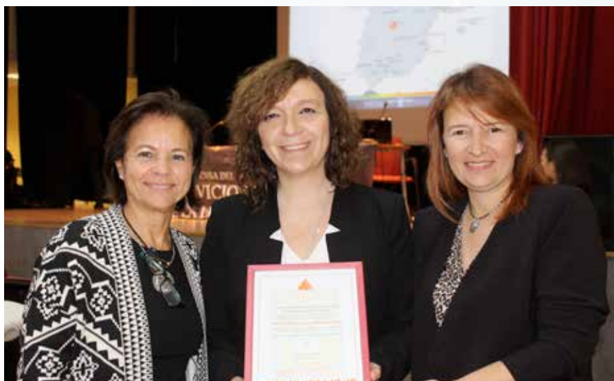
El reconocimiento se entregó en Madrid el pasado mes de noviembre

EL ÁREA DE Servicios Sociales atiende anualmente a 10.000 personas , ya que contempla a la sociedad alcazareña en su conjunto, en todas las franjas de edad. Desde la infancia, pasando por la juventud, familias, personas con capacidades diferentes, mujer e igualdad y mayores.