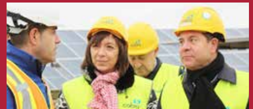
Ciudad sostenible Mayor parque solar de España