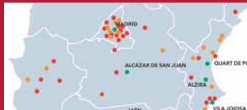
Ciudad con corazón Excelencia Servicios Sociales