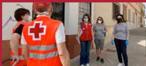
Ciudad con corazón