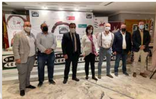
Juan Ramón Lucas en La Brújula

HASTA ALCÁZAR DE San Juan han llegado grandes voces de la radio de la mano de Onda Cero. El ayuntamiento emitía en directo el programa “Por fin no es lunes” de Jaime Cantizano en el que la alcaldesa participaba en directo y presentaba la ciudad destacando el patrimonio y las costumbres locales que nos hacen diferentes, la relación con El Quijote o nuestra vinculación al ferrocarril, siendo una ciudad de servicios. No faltaron las tortas de Alcázar para el equipo que dirige Jaime Cantizano. Tampoco se quedó sin tortas Juan Ramón Lucas que realizaba su programa, “La Brújula” , desde la sede del Consejo Regulador La Mancha.