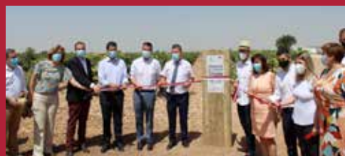
Ciudad colaborativa Uniando Municipios