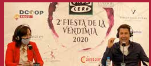
Ciudad mediática Alcázar en la radio