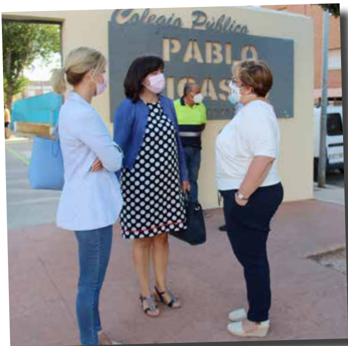
ROSA MELCHOR Y CARMEN OLMEDO, visitaron el CEIP Pablo Picasso para conocer las obras de mantenimiento que se llevaron a cabo financiadas por el gobierno de Castilla-La Mancha para garantizar una vuelta a las aulas segura.

EL AYUNTAMIENTO, AL igual que todos los años se encarga del mantenimiento y limpieza de los centros escolares y además como medida extraordinaria de prevención, ha ampliado el número de horas para la desinfección de las aulas. A comienzos de curso, el ayuntamiento distribuyó a todos los colegios estaciones de dispensadores de gel hidroalcohólico y mascarillas reutilizables para todos los alumnos/as que cursan Educación Infantil y Primaria.