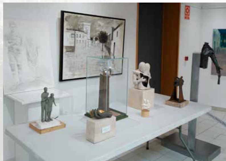
Propuestas Concurso Nacional de Escultura