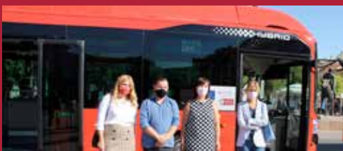
Ciudad sostenible Modelo de Ciudad