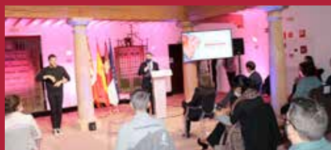
Ciudad sanitaria Ampliación del hospital