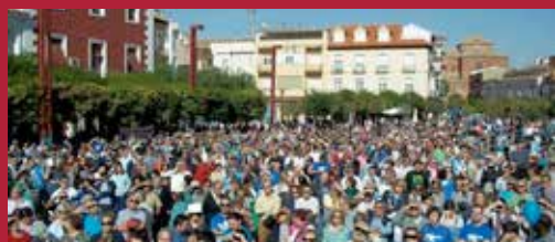
Ciudad luchadora Agua pública 100%