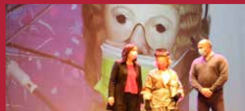
Ciudad digital Carnavalcázar 2020 online