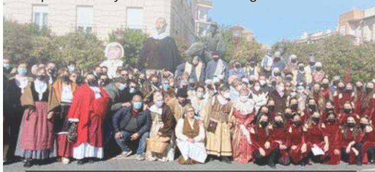
Ocho asociaciones locales participaron en la cabalgata recorriendo el casco antiguo y lugares cervantinos

EL MARIDAJE HA dado como resultado las JORNADAS VINO Y BAUTISMO QERVANTINO, que ha alcanzado la octava edición . Tal combinación, permite organizar una amplia programación que se este año se ha desarrollado del 5 al 14 de noviembre, con catas, rutas culturales, exposiciones y la tradicional Cabalgata Cervantina.