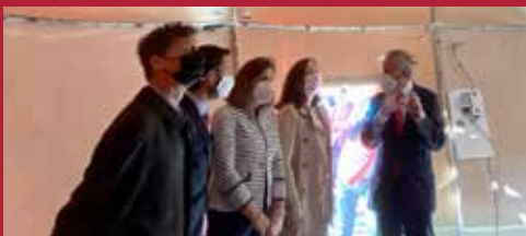
Apostando por las nuevas tecnologías Ciudad para el siglo XXI