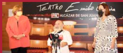
Acercando la cultura Teatro Emilio Gavira