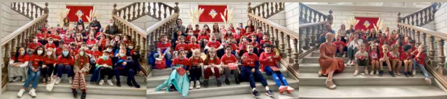
3º de Educación Primaria de los CEIP: Jesús Ruiz, Juan de Austria y Pablo Ruiz Picasso