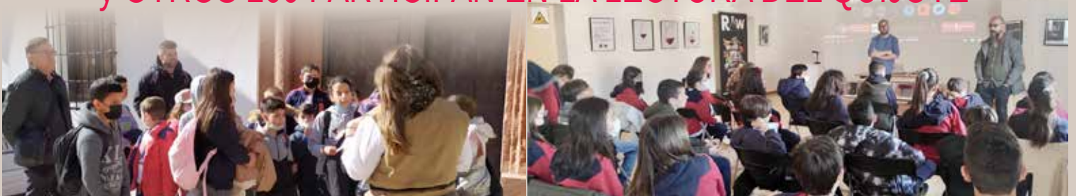
El alumnado de 3º y 4º de Educación Primaria participan en esta actividad