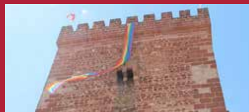
Alcázar, diversa y comprometida Ciudad inclusiva