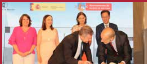
Alcázar apuesta por el hidrógeno Ciudad sostenible