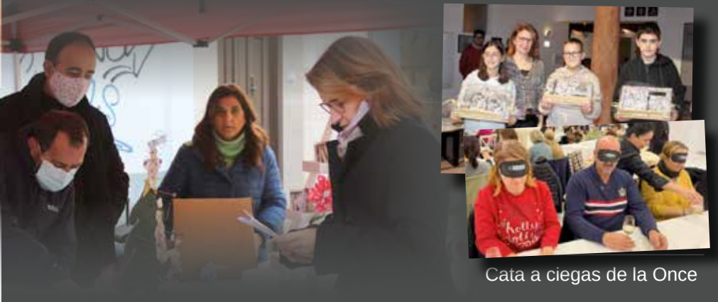
Cata a ciegas de la Once