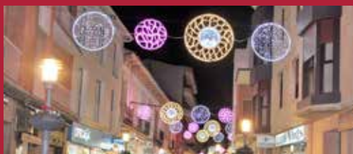
Alcázar, celebra la Navidad Navidades especiales