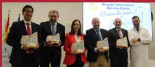
Alcázar con 'U' de Hospital Univeristario