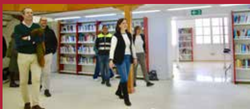
Alcázar accesible y eficiente Obras Casa de Cultura