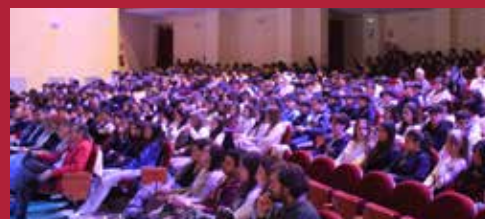
Alcázar acoge Ciudad de Congresos