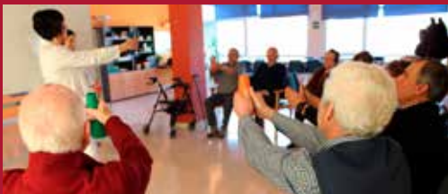
Ciudad Solidaria e Inclusiva Excelencia en Servicios Sociales