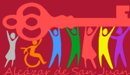
Ciudad Abierta Presupuestos Participativos