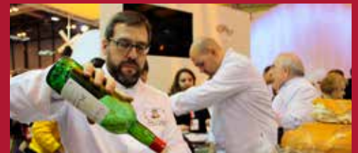
Ciudad Turística Destino de Calidad