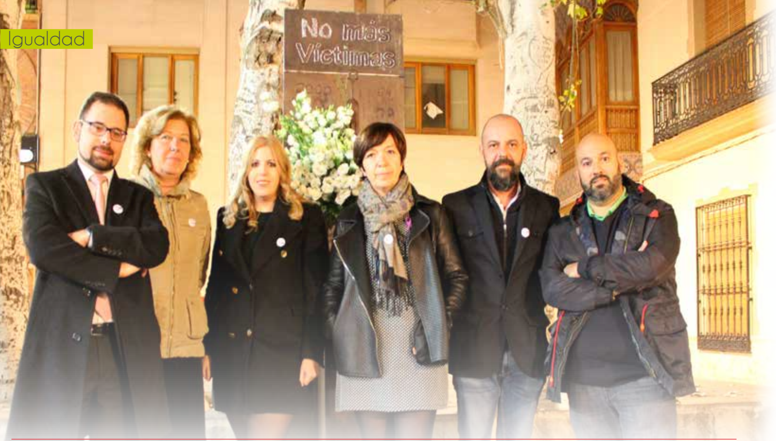
Frente al monolito en memoria de las víctimas por violencia de género. Acto institucional del 25 de Noviembre de 2017