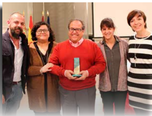
Alcázar recibió el premio de la FEMP el 30 de noviembre, Día de las Ciudades Educadoras