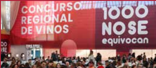
Alcázar es Región XIV Concurso Regional de Vinos