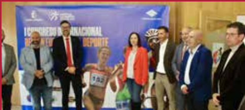
Alcázar con el deporte Ciudad deportiva