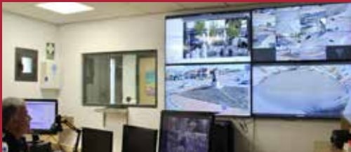
Alcázar vigila sus calles Seguridad ciudadana