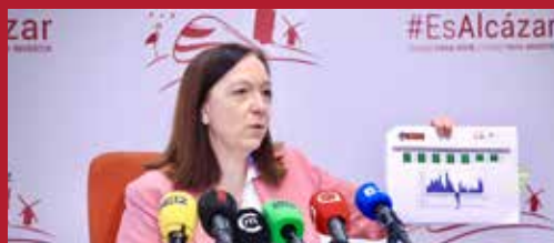
Alcázar consolida una década de crecimiento económico Cuentas municipales muy positivas