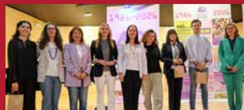
40 aniversario del Centro de la Mujer de Alcázar 40 años con Políticas de Igualdad