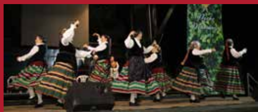
Alcázar celebra San Isidro Labrador Folklore, gastronomía y tradición